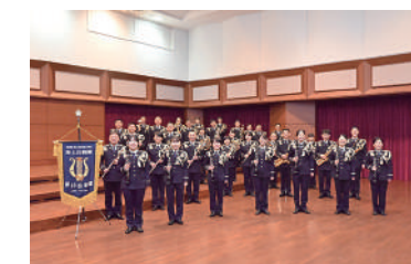
陸上自衛隊第10音楽隊