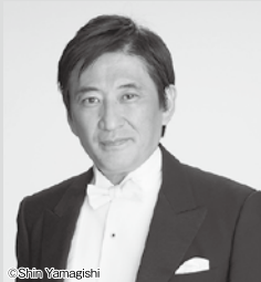
指揮 / 藤岡幸夫(芸術顧問)

大畑 真: 委嘱作品(世界初演) ベートーヴェン: ピアノ協奏曲 第3番ハ短調 作品37 シベリウス: 交響曲 第1番 ホ短調 作品39